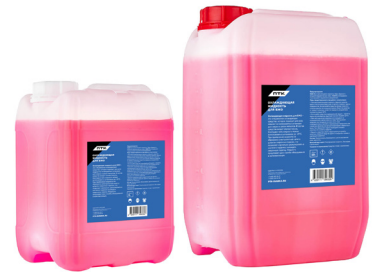
Охлаждающая жидкость ПTK для БЖО, 5л Артикул: 005.010.416

Средство для очистки алюминия и его сплавов. ALUM CLEAN быстро удаляет загрязнения с металла, устраняет застаревшие следы и пятна. Восстанавливает и возвращает металлу первоначальный блеск и яркость.