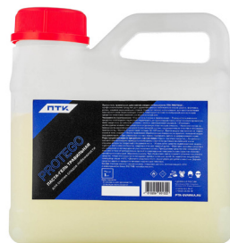
Паста-гель травильная для снятия следов побежалости ПTK PROTEGO, 1л Артикул: 005.010.428

Эмульсия для очистки от пленочных оксидов и пятен побежалости сварных швов легированных и нержавеющей сталей. Средство может быть использовано для очистки окисленных поверхностей изделий и предметов из легированных сталей от ржавчины.