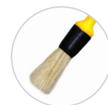
Кисть для эмульсии и пасты-геля Артикул: 005.010.439

Щетка совместима со всеми горелками TIG 17/18/26. Используют для очистки нержавеющей стали после сварки от цветов побежалости, копоти. Необходимый результат достигается только в паре с электролитом.