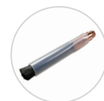
Щетка ПTK для электрохимической пассивации Артикул: 005.010.438

Средство используется в специальных установках для электрохимического травления нержавеющей стали или со специальной щеткой для электрохимической пассивации при помощи аппарата аргонодуговой сварки TIG.