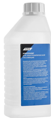
Электролит для электрохимической пассивации ПTK, 1л Артикул: 005.010.436

Травильная гель-паста ПTK PROTEGO используется для снятия следов (цветов) побежалости после сварки, формовки, резки и закалки нержавеющей сталей. Средство можно использовать для восстановления пассивного слоя нержавеющей сталей. После обработки сварной шов и свариваемая поверхность приобретают ровный матовый цвет, восстанавливается коррозионная стойкость нержавеющей стали. Благодаря вязкой гелеобразной консистенции состав возможно наносить на вертикальный шов.