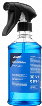
Очиститель и обезжириватель ПTK DUO CLEAN, 0,5л Артикул: 005.010.451

Очиститель и обезжириватель ПTK DUO CLEAN используется для обезжиривания и очистки от загрязнений конструкционной и нержавеющей стали, алюминия и его сплавов, в том числе от остатков следов полировальных паст. Средство можно использовать в промышленности для обработки металлических изделий перед сваркой, полировкой и окрашиванием.