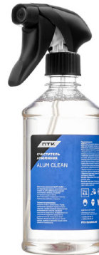
Очиститель алюминия ПTK ALUM CLEAN, 0,5л Артикул: 005.010.454

Средство для моментального удаления сильных загрязнений на изделиях из нержавеющей стали. INOX CLEAN работает как глубокий очиститель, который быстро удаляет загрязнения с металла, при этом не затрагивает защитный слой оксида на поверхности нержавеющей стали. Также, INOX CLEAN восстановит и вернет металлу первоначальный блеск и яркость.