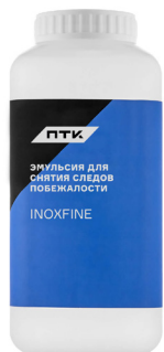
Эмульсия для снятия следов побежалости ПTK INOXFINE, 1л Артикул: 005.010.426

В ассортименте представлена тара объемом 5 и 10 литров.