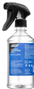
Очиститель нержавеющей стали ПTK INOX CLEAN, 0,5л Артикул: 005.010.452

Очиститель и обезжириватель ПTK DUO CLEAN используется для обезжиривания и очистки от загрязнений конструкционной и нержавеющей стали, алюминия и его сплавов, в том числе от остатков следов полировальных паст. Средство можно использовать в промышленности для обработки металлических изделий перед сваркой, полировкой и окрашиванием.